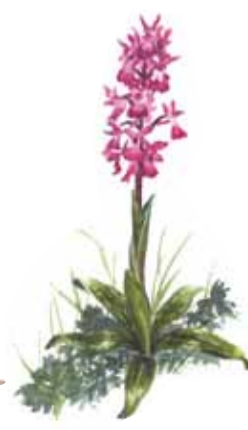
St Pers nycklar